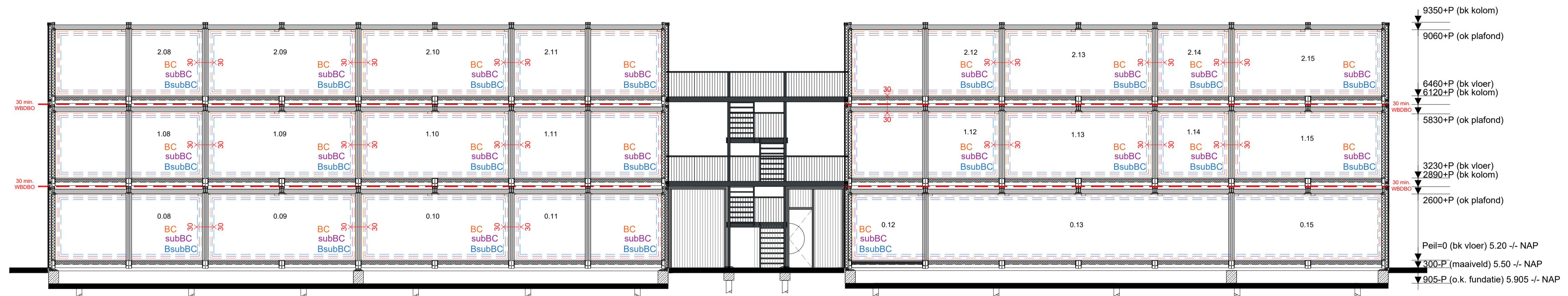
Principe doorsnede B-B