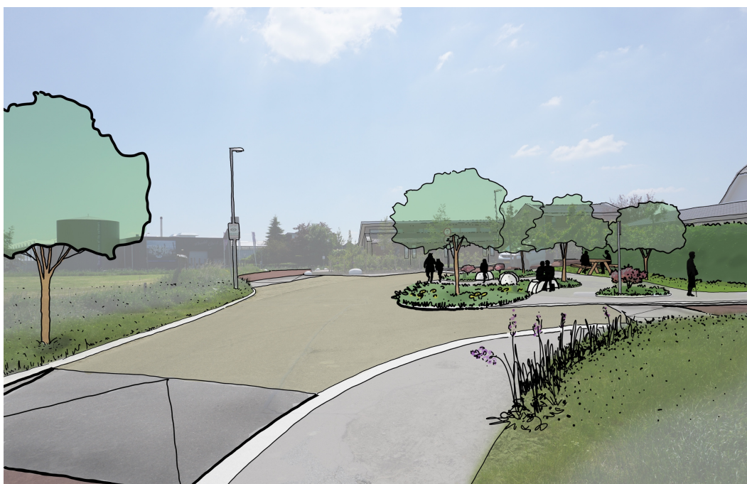
Impressie van kruispunt Julianastraat – Middelweg - Sportweg

Het kruispunt wordt zo compact mogelijk gemaakt om extra ruimte te geven aan voetgangers en leefbaarheid. Voor de bochtstralen is 6 meter aangehouden, passend gezien de functies van de weg. Deze bochtstralen dienen bij verdere uitwerking te worden gecontroleerd voor het grootste ontwerpvoertuig. Op het midden van het kruispunt is een doorrijbreedte van 6,0 meter aangehouden zodat groter verkeer (zoals tractoren en vrachtauto's) ook kan worden gefaciliteerd.