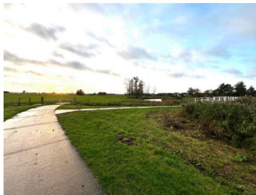
Figuur 2 en 3 Uitzicht over Zwartewater en het startpunt bij het witte bruggetje