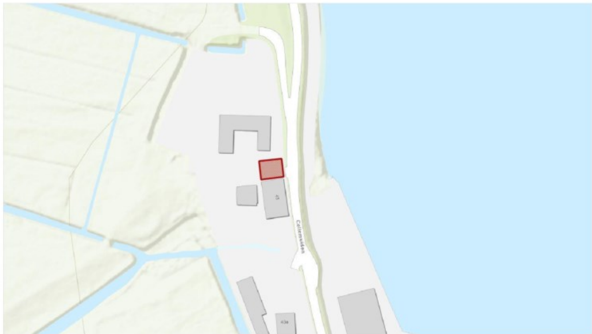
Figuur 1.1 Ligging plangebied.

Econsultancy heeft in opdracht van [redacted] J een onderzoek industrielawaai uitgevoerd in het kader van de voorgenomen ontwikkeling aan de Cellemuiden 43 te Hasselt. De nieuw te realiseren geluidgevoelige bestemming liggen in de zone van het gezoneerde industrieterrein Machinefabriek Hasselt B.V. Het akoestisch onderzoek heeft als doel het bepalen van de geluidsbelasting op de nieuw te realiseren woning ten gevolge van het industrieterrein. figuur 1.1 is de situering van het plan weergegeven.