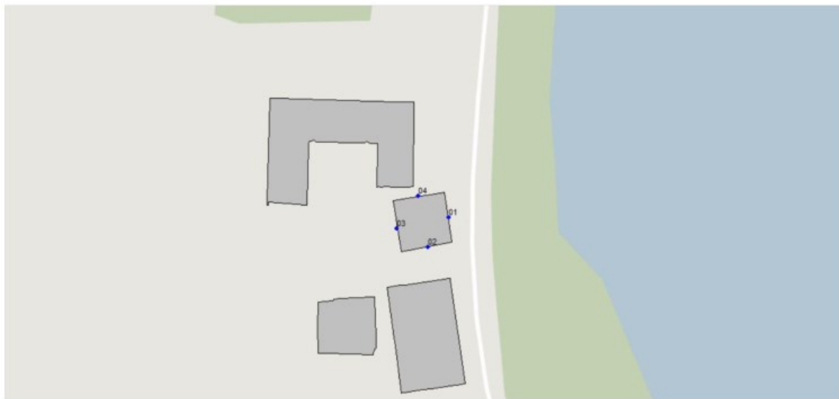
Figuur 3.1 Woning met toetspunten.

De woning zal gerealiseerd worden ter plaatse van de bestaande schuur. Voor elke zijde van de te realiseren woning zijn toetspunten ten behoeve van 3 bouwlagen gemodelleerd. In figuur 3.1 is de situering van de woning met de situering van de toetspunten weergegeven.