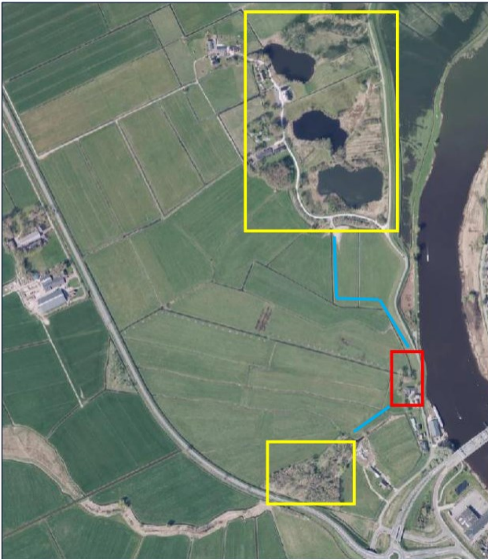
Afbeelding 5.3. Projectgebied (rood kader) met verbindingroutes langs sloten (blauwe lijnen) naar geschikt leefgebied (gele kaders) voor kleine marterachtigen.

Gezien de aanwezige vegetatie (struweel en bomen) is het mogelijk dat het projectgebied als verbindingszone gebruikt wordt door kleine marterachtigen tussen geschikte leefgebieden (zie afbeelding 5.3). Door het ontbreken van geschikte verblijfplaatsen binnen het projectgebied, is er geen sprake van essentieel leefgebied. Omdat de huidige vegetatie behouden blijft is er geen negatief effect op kleine marterachtigen en egel.