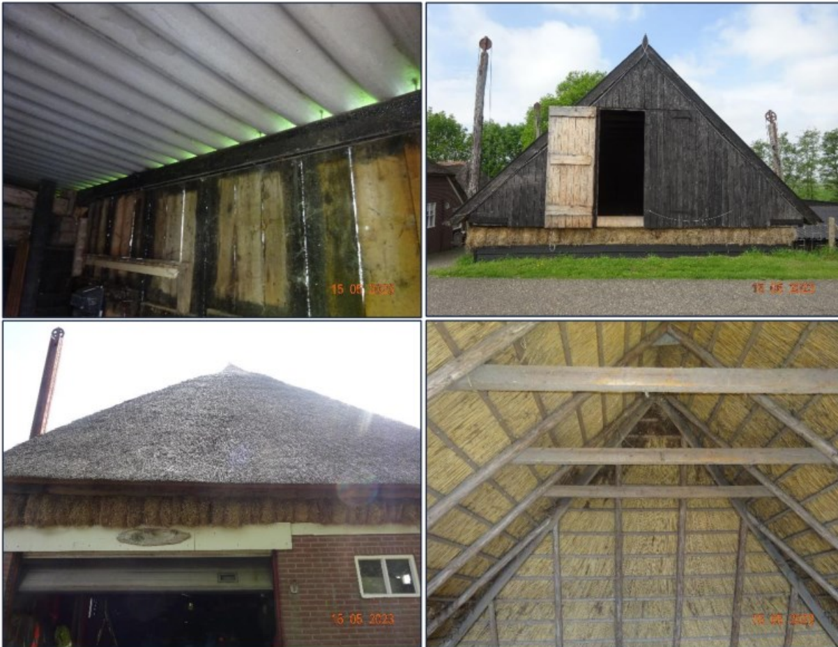
Abbeelding 5.4. Links boven: binnenkant schuur met golfplaten dak. Rechts boven en links- en rechtsonder: hooischuur.

Het projectgebied is (onderdeel van) het leefgebied voor o.a. zangvogels. Het is aannemelijk dat zangvogels de bomen en bosschages in het projectgebied als broedlocatie gaan gebruiken. Verstoring van broedvogels kan voorkomen worden door de voorgenomen werkzaamheden buiten het broedseizoen uit te voeren. Het broedseizoen is globaal aan te geven tussen 15 maart en 15 juli, afhankelijk van de weersomstandigheden. Eerdere en latere broedgevallen zijn ook beschermd conform de Wet natuurbescherming. Als toch gewerkt wordt tijdens het broedseizoen, dienen de aanwezige bosschages niet te worden verstoord. Ook is het mogelijk maximaal 3 dagen voor aanvang van de werkzaamheden het projectgebied te laten controleren op de aanwezigheid van broedende vogels door een deskundig ecooloog.