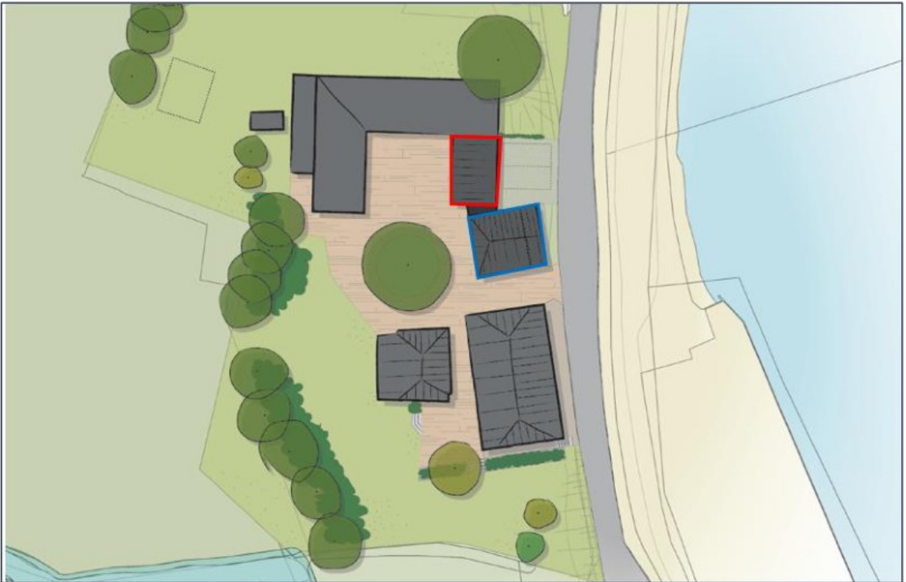
Afbeelding 3.3. Te slopen deel schuur (rood kader) en om te vormen hoischuur (blauw kader).