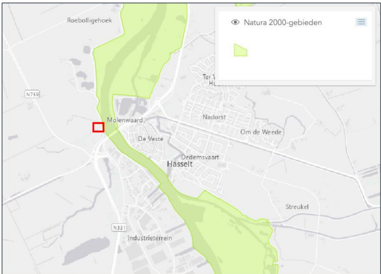
Afbeelding 5.1. Ligging van het projectgebied (rood kader) t.o.v. Natura 2000-gebied Uiterwaarden Zwarte Water en Vecht (groen vlak).

Eventuele effecten van de stikstofemissie op Natura 2000-gebieden als gevolg van de werkzaamheden en het toekomstig gebruik vallen buiten het kader van dit onderzoek.