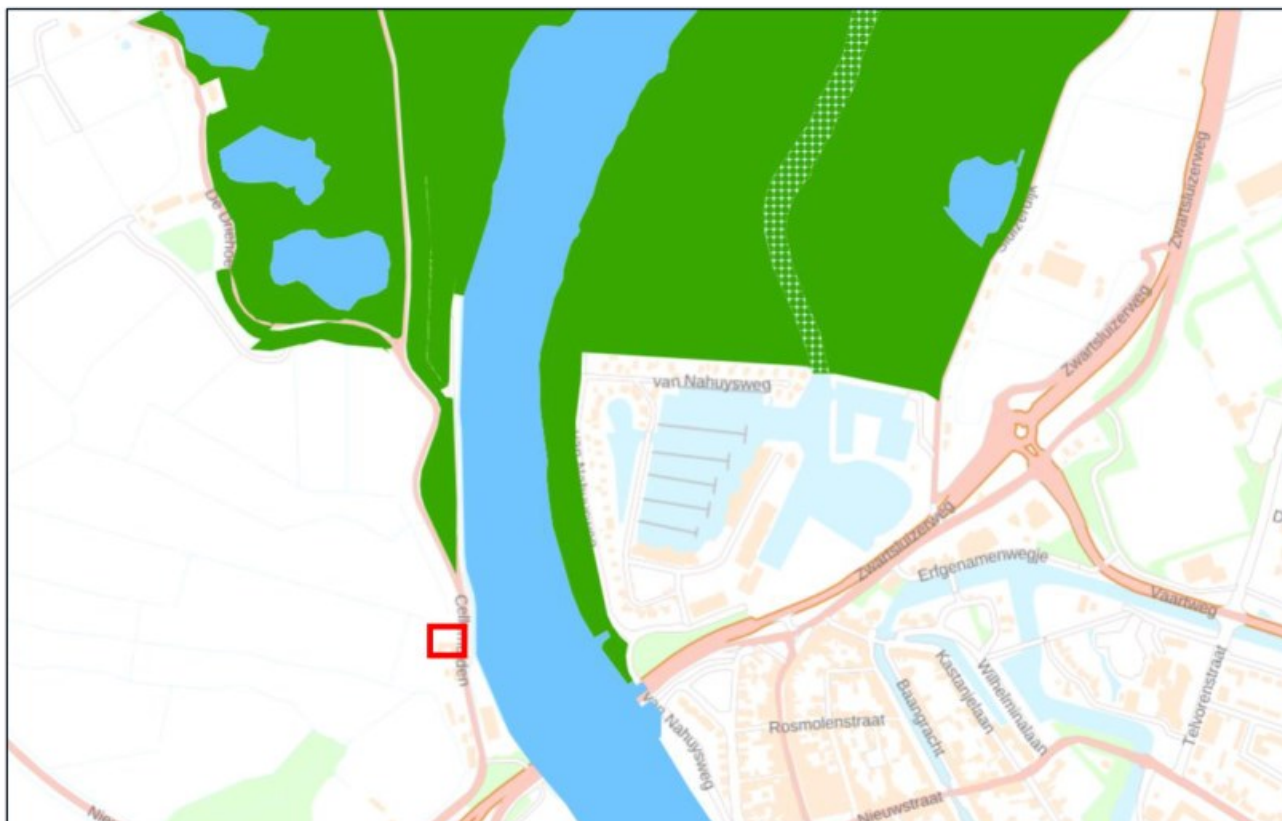
Afbeelding 5.2. Ligging van het projectgebied (rood kader) t.o.v. Natuurnetwerk Nederland gebied (groene vlakken).

Omdat het projectgebied zich buiten de begrenzing van het NNN bevindt, gecombineerd met de beperkte ingreep, kan verstoring van NNN-gebieden op voorhand worden uitgesloten.