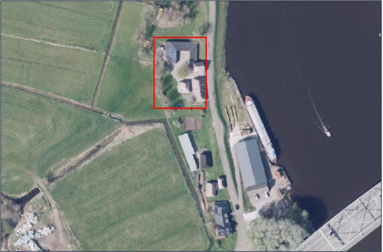
Afbeelding 3.2. Luchtfoto van het projectgebied (rood kader).