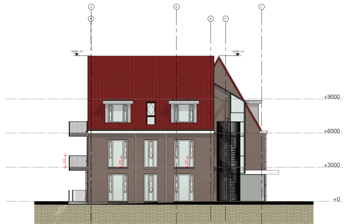
Rechtergevel 1 : 100