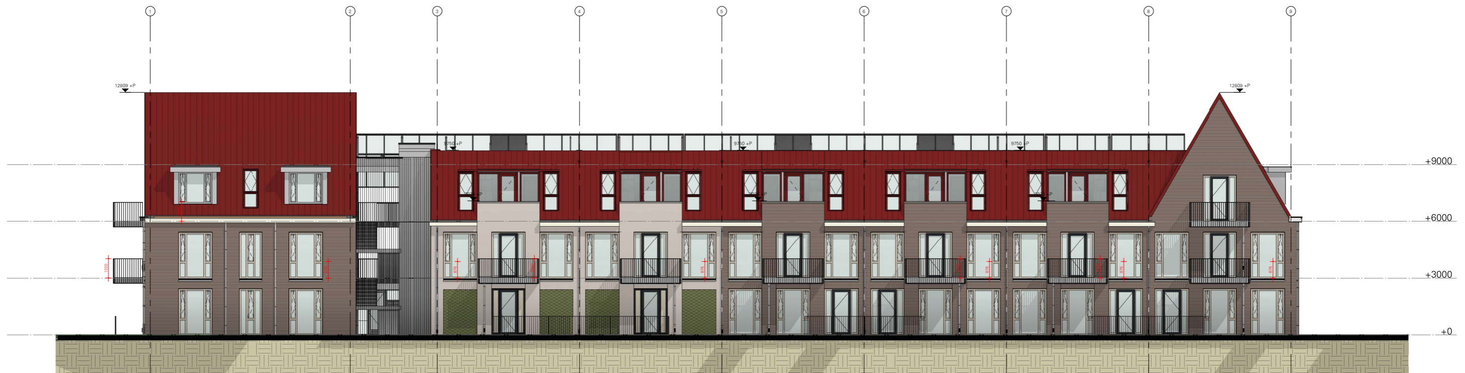
Voorgevel 1 : 100